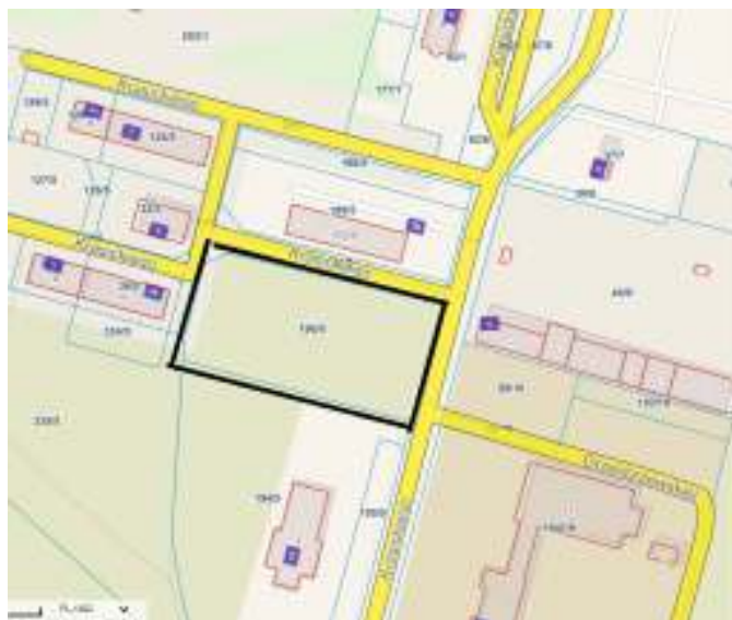
Lokalizacja inwestycji

Planowana inwestycja zlokalizowana jest w Krupskim Młynie przy ul. Krasickiego na działce nr 196/5. Poniżej przedstawiono lokalizację inwestycji wraz z bezpośrednim otoczeniem: